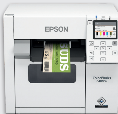
Gamme ColorWorks C4000e